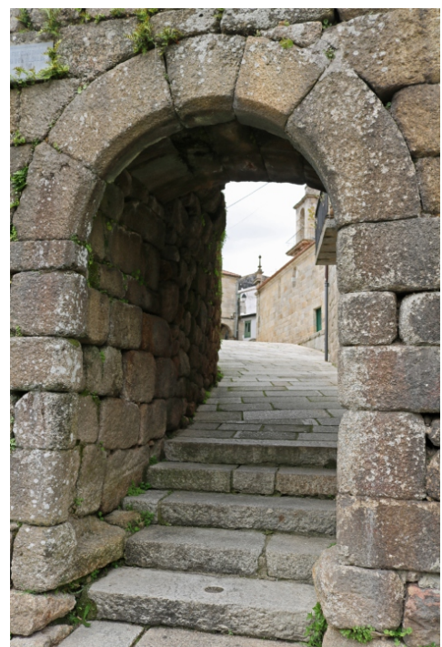
Porta da muralla (Porta Falsa)