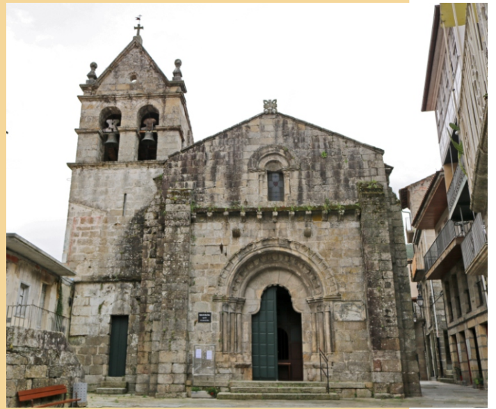
Igrexa románica de San Xoán