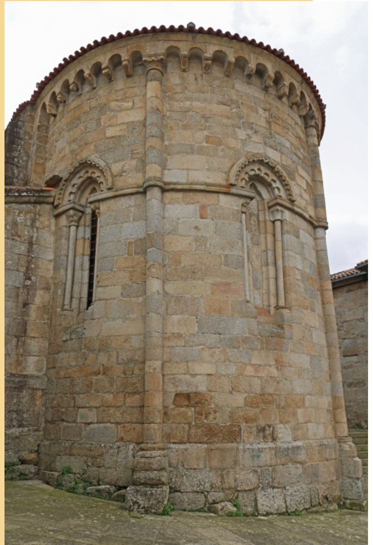
Igrexa románica de Santiago, de finais do século XII