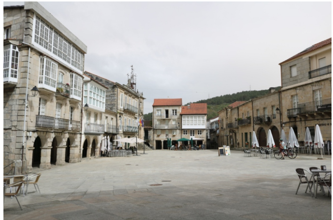
Praza Maior, onde se atopa o concello e a oficina de Turismo