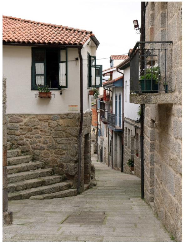
Rúa dos Fornos