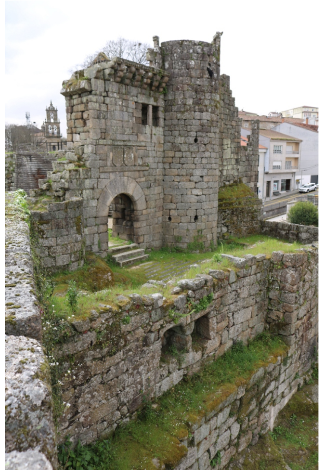
Castelo de Ribadavia construído a partir do século XI

Ribadavia, centro da comarca do Ribeiro, vila de longa tradición e historia, ten unha morea de atractivos polos que ben merece unha visita: historia, ligada ao seu castelo e aos xudeus, arte de diferentes épocas, tradicións e saber, ligados á etnografía e ao viño, e natureza e lecer á beira do Avia.