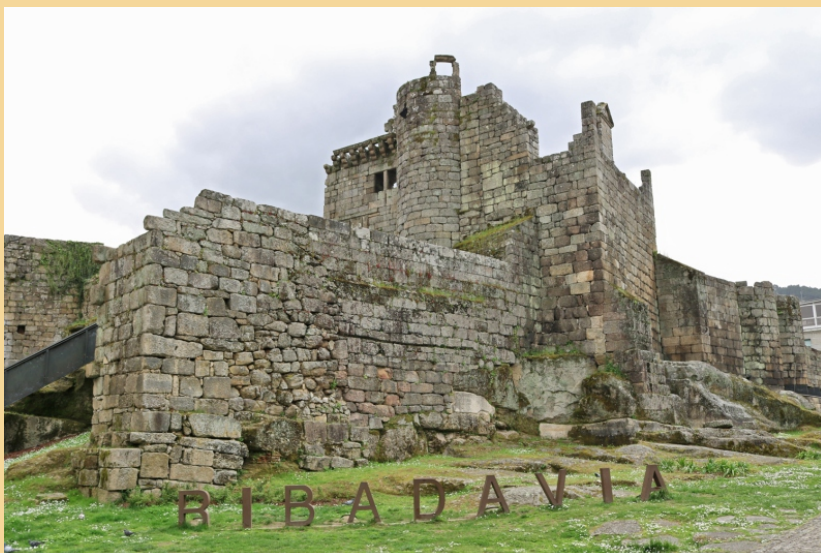
Castelo de Ribadavia

Facendo un percorrido amplo, achegándonos na parte alta da vila para coñecer as igrexas da Virxe do Portal e do convento de San Domingos, e as tilleiras da súa contorna protexidas como árbores senlleiras no catálogo da Xunta de Galiza, e indo pola beira do Avia ata a desembocadura, uns 2 km ida e volta, e á Veronza, uns 4 km ida e volta, máis os entre 2 e 3 km de percorrido polas rúas da vila e as visitas, completamos unha boa xornada de andar e ver. Para completar o día, aproveitando que estamos preto, e que o seu contido ten moito que ver co ser de Ribadavia, podemos achegarnos ao Santo André do Campo Redondo, uns 6 km, para coñecer o Museo do Viño de Galiza no que ademais do interese do contido podemos gozar dunha fermosa panorámica da contorna e descubrir, con sorpresa, a magnitude da importancia do cultivo da vide na zona. Aínda que para chegar a el botamos de menos uns sinais indicadores que nos sirvan de guía.