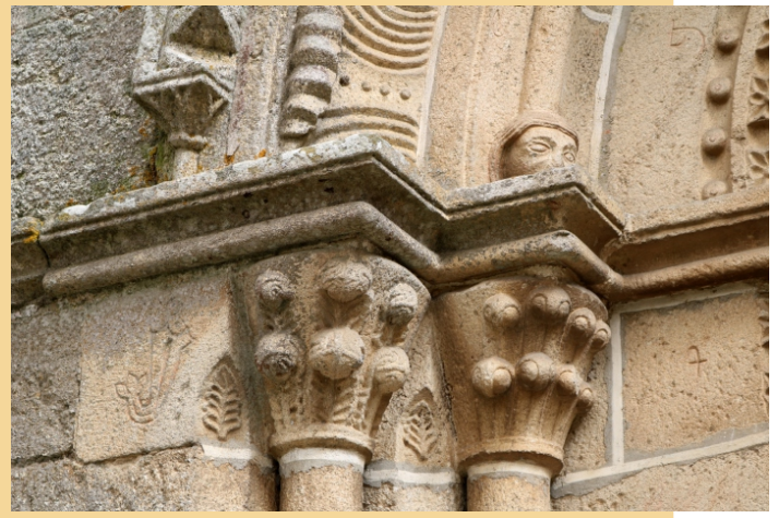
Igrexa de San Domingos