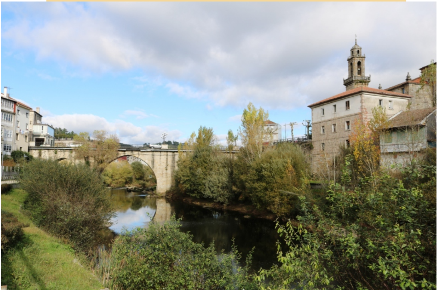
O Avia desde Extramuros, coa ponte e o convento de san Francisco