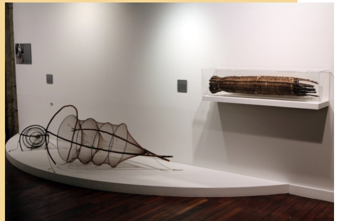
Museo etnolóxico de Ribadavia